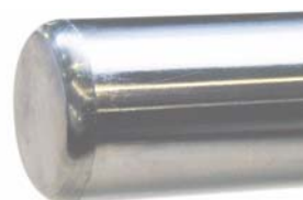
Fig. 3: Estremità della barra con smusso d'inserimento

Il dispositivo bloccastelo è costruito per l'impiego su barre tonde lisce.